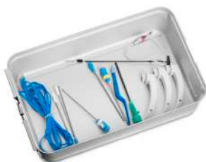
Ларингоскопы и лезвия