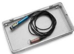
Шейвер ручного блока