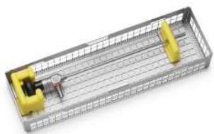
Эндоскоп для оптики

Эндоскопы и подобное оборудование стерилизуются программой "Эндоскопы".